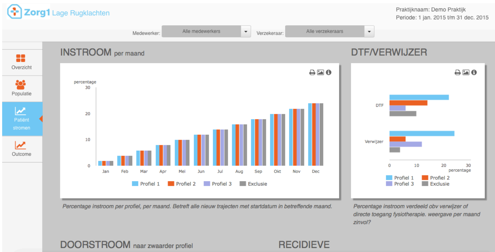
Figuur1: Een voorbeeld van het Zorg1 dashboard